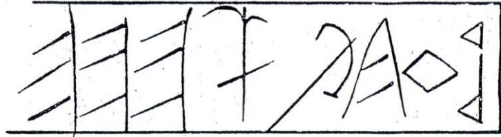
A róvasbetűs téglá.

A mellékelt ábra a 85 évvel ezelőtti újságból származik. Friedrich Klára