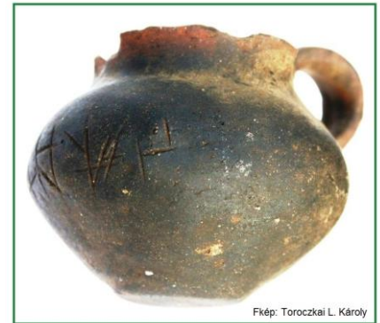
Fkép: Toroczkai L. Károly

A fényképet Toroczkai L. Károly készítette. Folytatjuk. Friedrich Klára