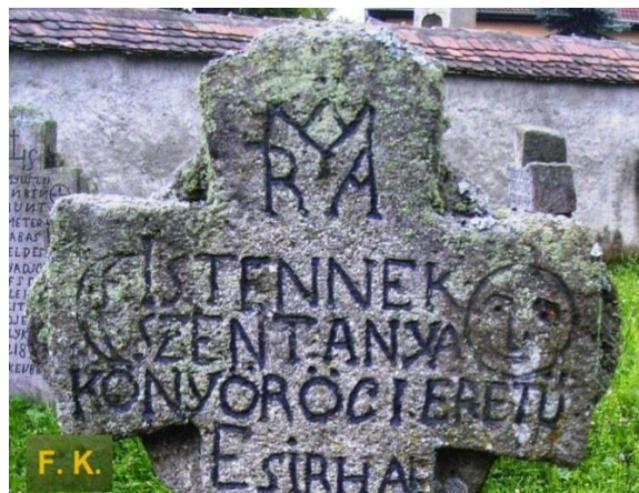
Csíkkozmási sírkő.

III. sor: 5. ZSOTÁR, AZ KR(ISZTUS) U(RUN)K, RÁRÓTA I