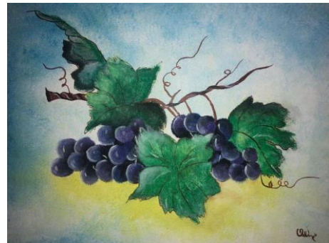
Orbán Erika festménye