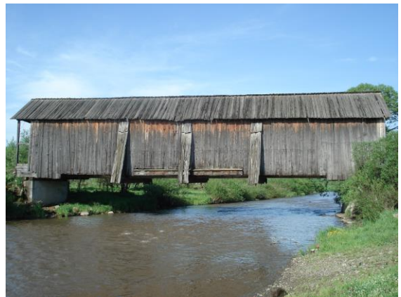
Korabeli kép a 90-es évekből