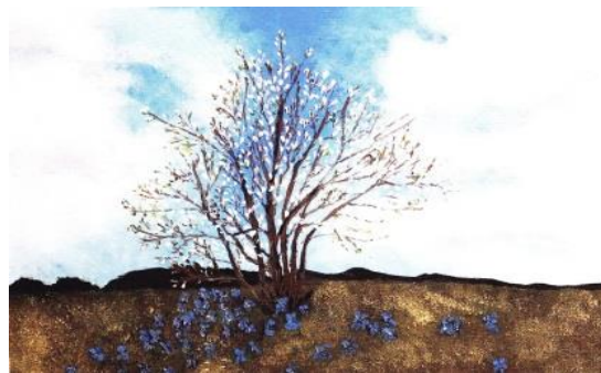
Orbán Erika festménye